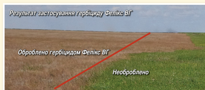
Результат застосування гербіциду Фелікс ВГ

Тож якісні продукти та прийнятний сервіс — до послуг українських сільгос-